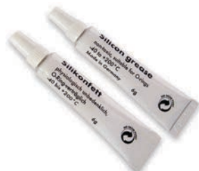
Silikonfett Tube 6g